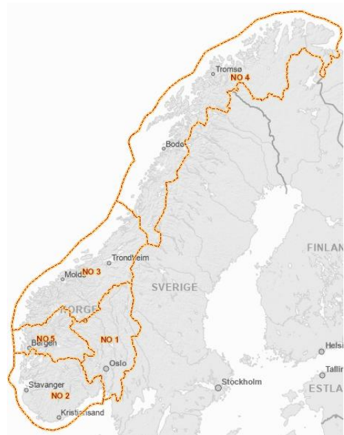
Figur 1: Elspotområder i Norge i 2025

RME beregner årlig en referansepris på kraft for hvert av de fem elspotområdene i Norge. Referanseprisen på kraft vil dermed variere mellom nettselskapene avhengig av hvilket prisområde de er lokalisert i.