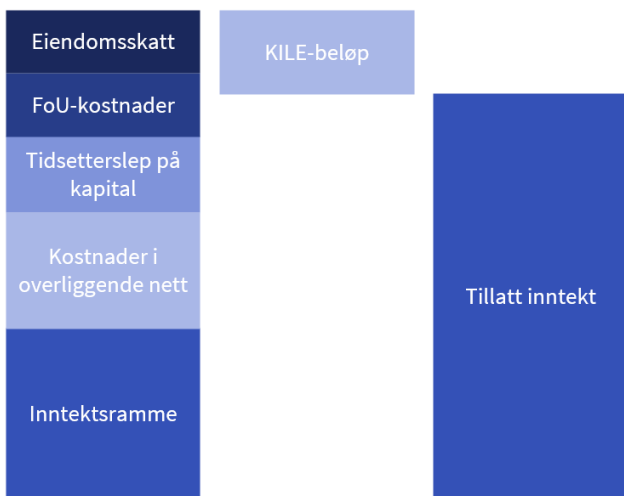
Figur 2: Elementer som inngår i tillatt inntekt

Tillatt inntekt består av flere elementer, som vist i Figur 2.