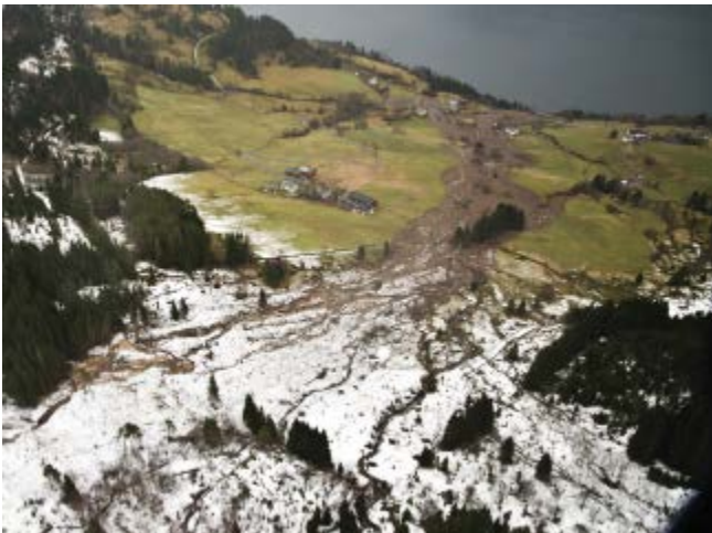
Klimautviklingen bør gi økt aktsomhet mot ulike typer skred. Her fra sørpeskred i Høyanger, jula 2011.

Noen faktorer bidrar også til å redusere skredfaren, som heving av skoggrensen. Skoggrensen påvirkes av klimatiske forhold, beiting og skogsdrift. Samtidig kan menneskelige inngrep i terrenget også øke faren for skred. For eksempel har uheldig bygging av adkomstveier med utilstrekkelig drenering i fjell-lier ført til lokale flommer og jordskred.