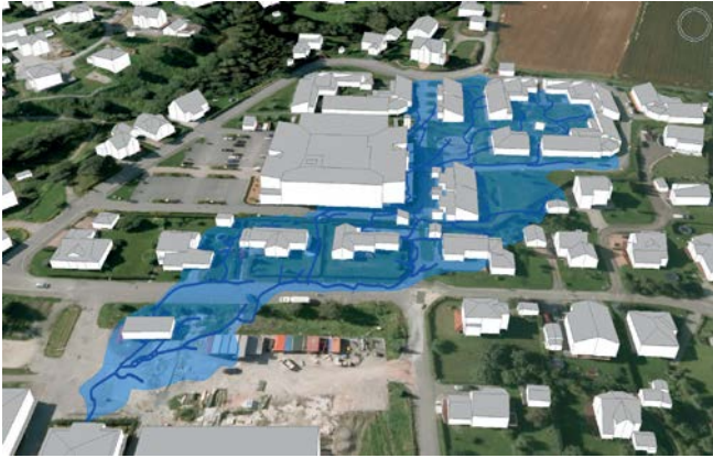
Kartlegging av flomveiene kan hindre skade når styrtregnet treffer. Utsnitt av GIS-analyse for Nedre Eiker kommune. Utarbeidet av Rune Bratlie.