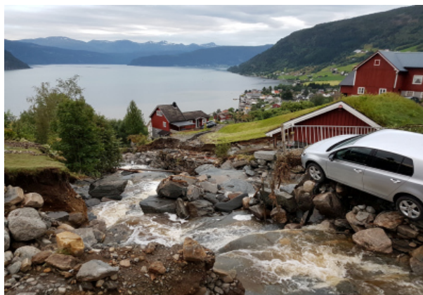
Store skader forårsaket av flom i Utvik i 2017.

Arealplanleggingen må ta hensyn til den økte flomfaren, jf. TEK 17. Kommunene må ha oversikt over hvor bekkene går gjennom bebygde områder, hvor kritiske kulverter og bruer er, og hvor vannet renner når disse går tett. Det beste generelle rådet er å holde bebyggelsen i god avstand fra vassdragene. Det må vises særlig aktsomhet langs bratte vassdrag der vannet kan grave ut nye løp eller rive med seg masser i farlige flomskred.