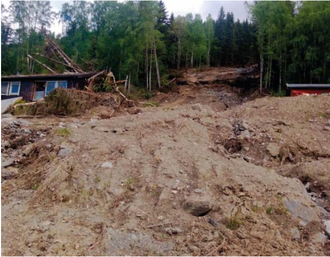
Det kan forventes økt hyppighet av jord- og flomskred. Bildet viser jordskred i Aurland i 2013.