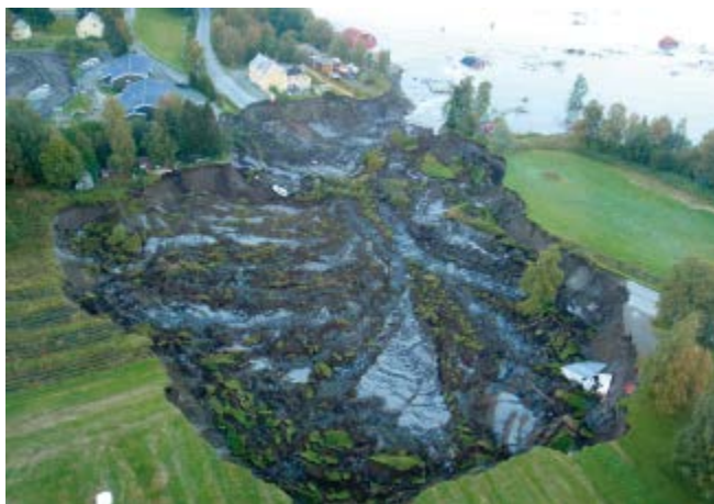
Kvikkleireskred i Lyngen i Troms 3. september 2010.

Det er viktig med økt aktsomhet mot alle typer skred. Ved utredning og kartlegging av skredfare er det viktig at alle typer skred vurderes. Det er likevel slik at usikkerheten i fastsettelsen av grensen for skred med en årlig sannsynlighet på 1/1000 er så stor at effekten av klimaendringer har liten betydning. Ved avgrensning av faresonekartgrenser for skred i forbindelse med arealplanlegging, er det derfor ikke behov for å legge til en ekstra margin som følge av klimautviklingen. NVEs retningslinjer « Flaum- og skredfare i arealplaner » viser hvordan en kan ta hensyn til skredfare i arealplaner.