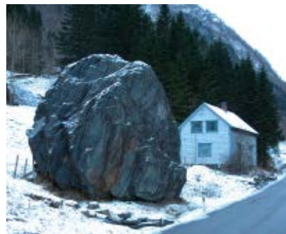
Hendelser med steinsprang og steinskred kan bli hyppigere med mer ekstremnedbør. Her fra Mundheim i Kvam herad i 2004.

Det er en klar sammenheng mellom nedbør, temperatur, vind og ulike former for snøskred. Gradvis høyere temperatur vil etter hvert gi kortere snøsesong, og kystnære strøk i lavlandet kan bli helt snøfrie. Faren for tørrsnøskred vil etter hvert reduseres fordi temperaturstigning vil føre til både høyere snøgrense og høyere tregrense, mens faren for våtsnøskred og sørpeskred i skredutsatte områder vil øke. Skredene kan også ramme andre steder enn tidligere.