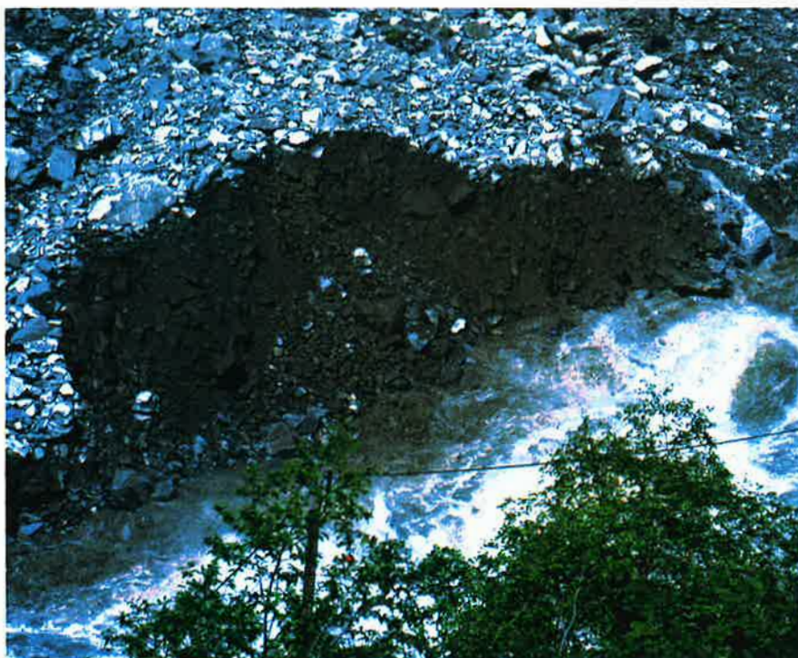
Erosjon i det vernede Utlavassdraget i Sogn