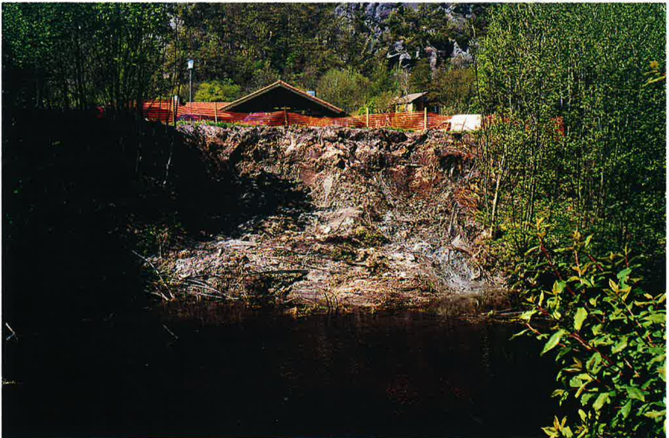
Ras i elvekant

For alle tiltak som utføres med bistand fra NVE må det foreligge et kommunevedtak. Der garanterer kommunen for innbetaling av distriktsandel og forplikter seg til å gjøre anleggets eier oppmerksom på driftsansvaret etter vassdragslovens § 115. Kommunen har mulighet til å kreve distriktsandelen tilbakebetalt fra andre interessenter. Kommunevedtaket forplikter også kommunene til å være tiltakshaver ved gjennomføring av arbeidet.