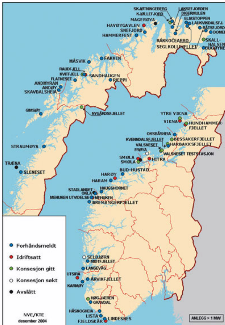
Fig. 1 Vindkraftprosjekter til behandling i NVE.

NVE behandler pr 1.12.04 37 meldinger om vindkraftprosjekter. Dette er prosjekter som er i en tidlig fase i planleggingen. Hensikten med en melding er å gi en tidlig varseling til myndigheter og berørte om at en tiltakshaver er i gang med planleggingen av et vindkraftprosjekt. I meldingen skal det også legges frem et utkast til utredningsprogram