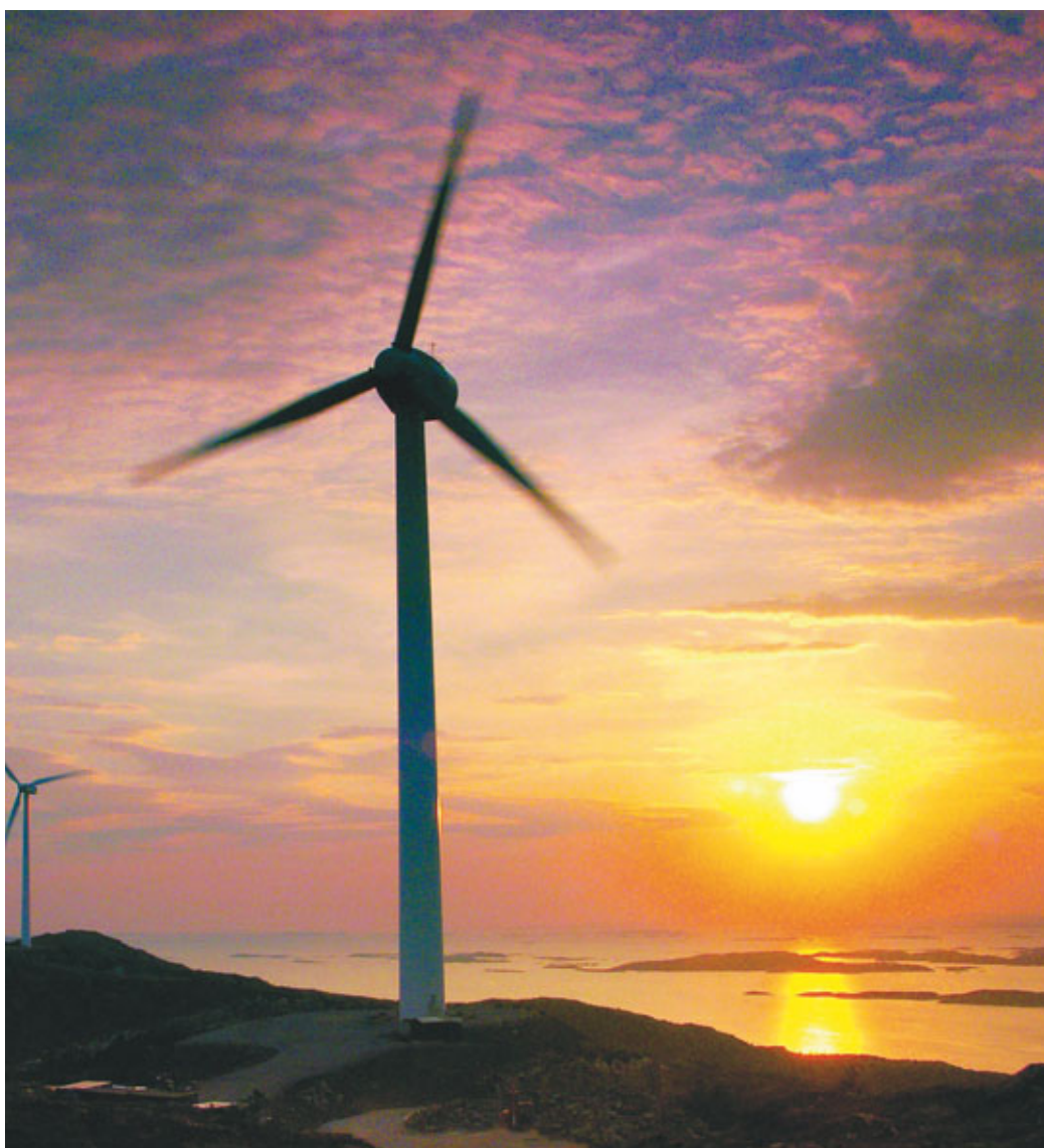
Hundhammerfjellet og Folla i kveldssol.

NVE og Reindriftsforvaltningen mener at det i enkelte tilfeller kan være aktuelt å gjøre undersøkelser for å fastslå nyttevirkningene av avbøtende tiltak fastsatt gjennom konsesjonsvilkår. Dette fordi det i enkelte tilfeller kan tenkes at virkningene av ulike tiltak er usikre. Slike undersøkelser kan enten være fastsatt som egne konsesjonsvilkår eller gjennomføres gjennom opplegg (f.eks FoU) som ikke er knyttet til den konkrete konsesjon.