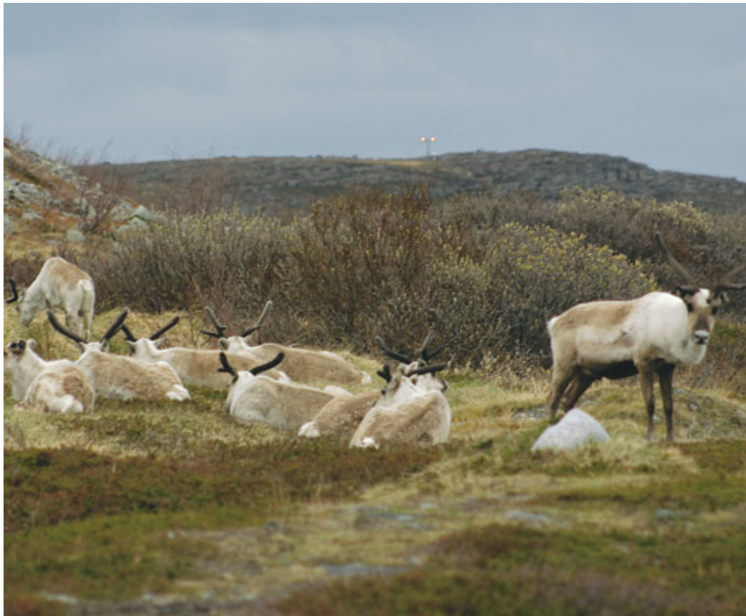
Reinflokken er gått til ro i betryggende avstand fra flyplassen i Vadsø.