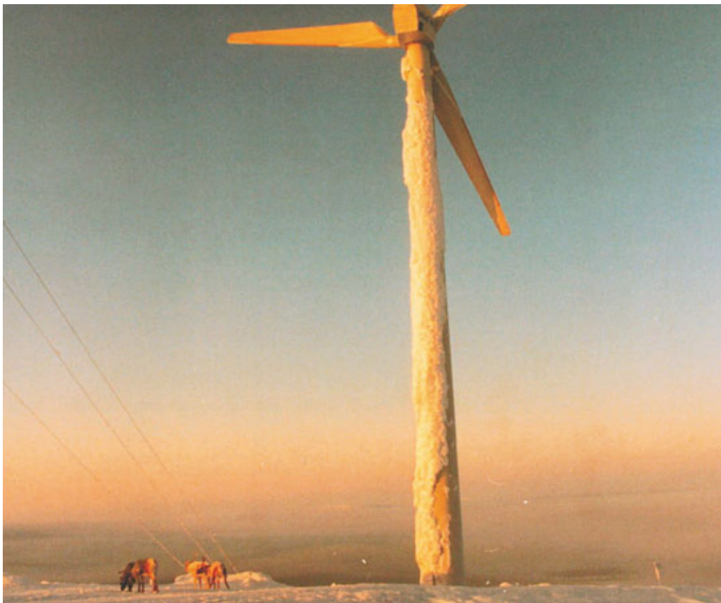
Reinsdyr nær vindturbin i Finland.

forholde seg til for tiltakshaver. Det er først og fremst siidaen som i den senere tid har fått økt betydning gjennom rettspraksis og økt politisk bevissthet. Siidaen er et begrep som brukes om reindriftens tradisjonelle arbeidsfellesskap. Siidaen består av mange enkelt-reineiere som deler på arbeidet, men der hver enkelt reineier har eiendomsrett til egne rein. Et reinbeitedistrikt kan bestå av en eller flere siidaer, og bruken til siidaene er oftest som den har vært fra gammelt av. Det betyr at de fleste siidaer gjennom alders tids bruk har etablert meget sterke bruksrettigheter i og på sine tradisjonelle områder.