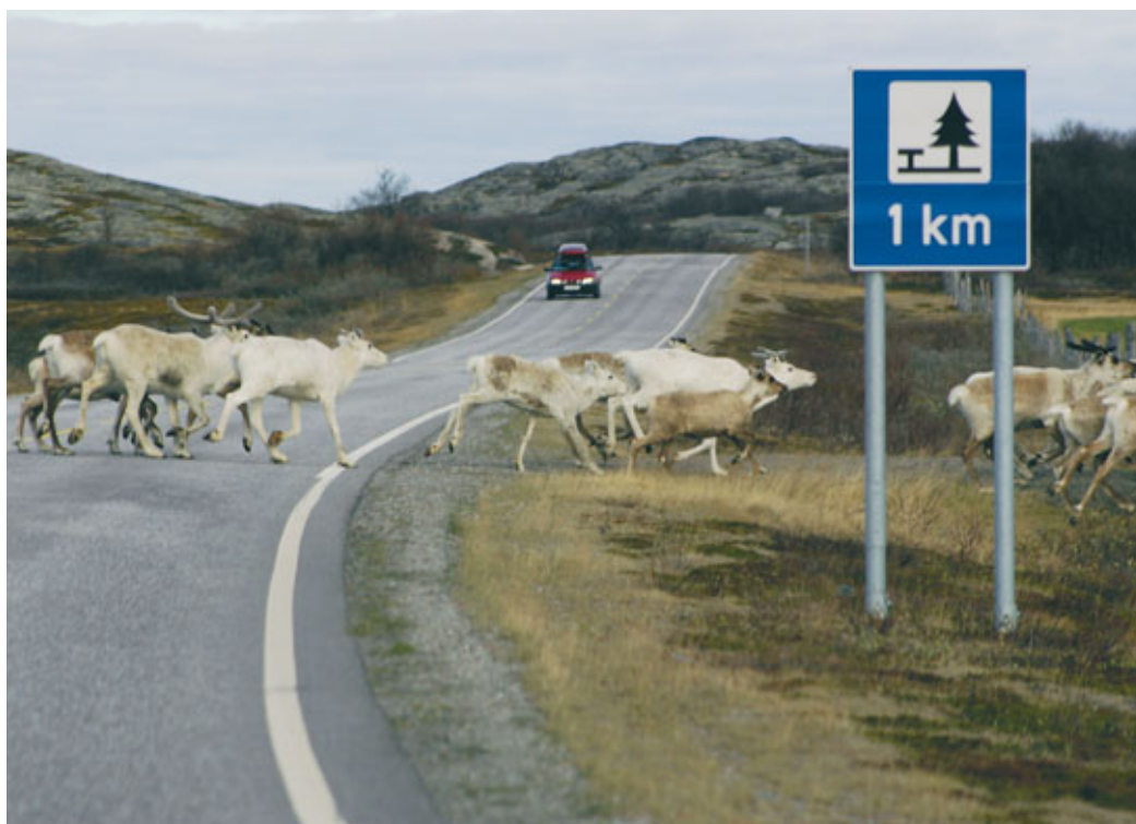
Veier er blant infrastrukturtiltakene som er med på å fragmentere reinbeitelandet.

Reindriftsutøvernes rettigheter og plikter er beskrevet i reindriftsloven kapittel III. Reindriftsretten er i § 9 definert som en bruksrett som gjelder uavhengig av grunneierforhold